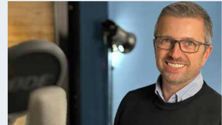
Pascal Wiedemann · www.epg.lohnkonzept.de