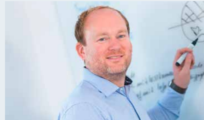
Peter Reininghaus · www.lohnkonzept-netzwerk.de