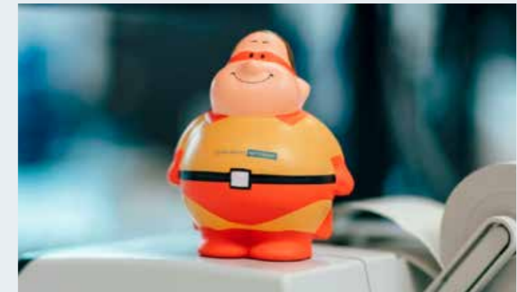
PePe · www.lohnkonzept-netzwerk.de

” DER BESTE UND KURZWEILIGSTE PODCAST, DEN ICH BISHER ZU LOHNTHEMEN GEHÖRT HABE. PRAXISNAH, VERSTÄNDLICH UND IMMER AKTUELL. ECHT SUPER! “